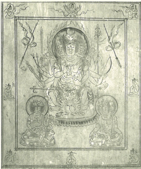
牛頭天王曼荼羅・獅子牡丹図衝立